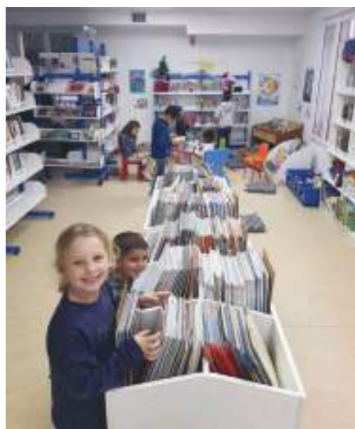
Classes de l'école Daniel Balavoine