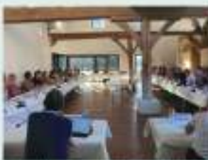
Conseil communautaire du 12/09/22