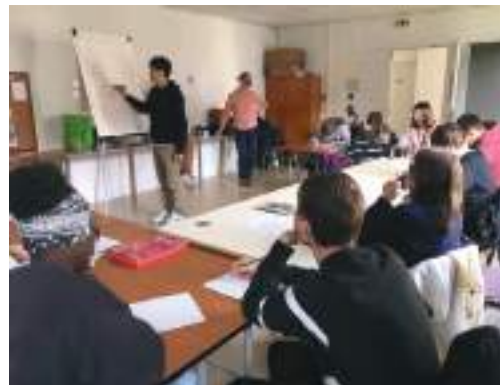
Atelier Manga du 25 Octobre

L'inscription est de 10€ par an et par famille. Vous pouvez venir vous inscrire à n'importe quel moment de l'année, l'inscription se fait de date à date.