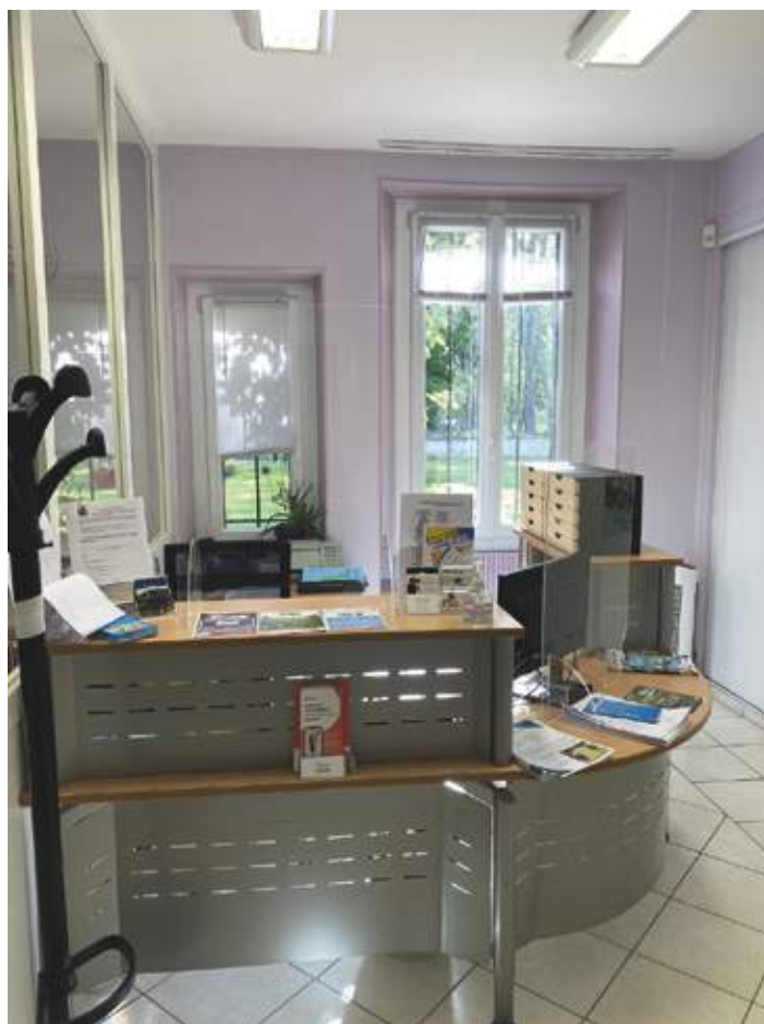
nouvel accueil mairie

L'agence postale communale ne prendra en revanche pas en charge la gestion des services financiers.